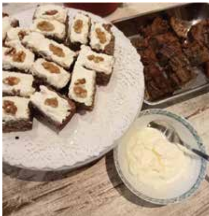
Inspectie dorps huis Kredo Bananecake gebakken door Riet