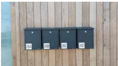
Huisnummers zijn op de tijdelijke woningen en brievenbussen gekomen!